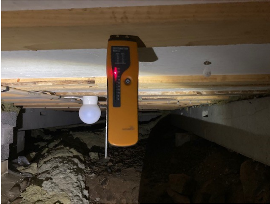
Fuktmätning i krypgrunden.