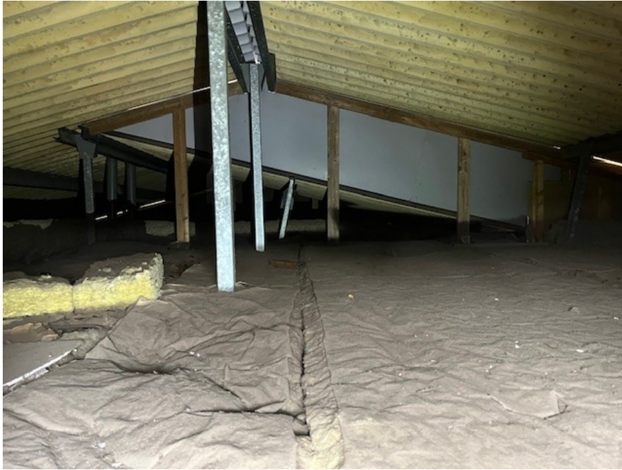
Nockvind via lucka.