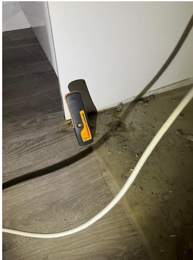
Fuktmätning i laminatgolv framför kylskåp.