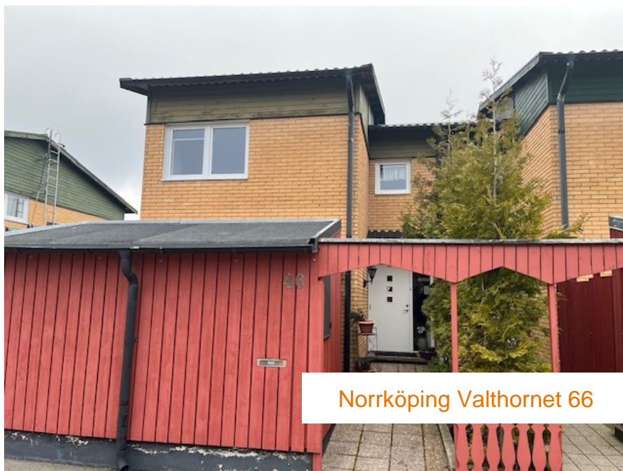
Norrköping Valthornet 66